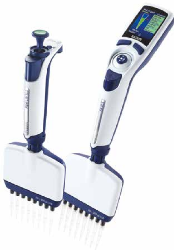
Modely Pipet-Lite XLS+ a E4 XLS+

Rychlejší práce s destičkami díky elektronickým vícekanálovým pipetám Rainin E4 XLS+. Speciální režimy usnadňují a zrychlují vícenásobné dávkování, sériová ředění a umožňují předem naprogramovat celé řady přenosů objemů.